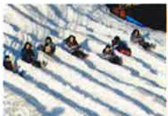
愛知なごや雪まつり (写真は昨年の様子)