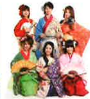
愛・パークイベントを盛り上げる「あいち戦国姫隊」

*スタートは、瀬戸蔵(名鉄瀬戸線尾張瀬戸駅)が最寄駅です。 スタート受付8時30分～11時まで ゴール受付15時までです。