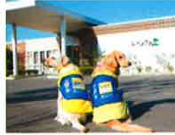
介助犬総合訓練センター ～シンシアの丘～