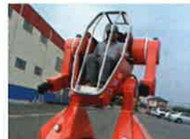
瀬戸蔵に登場する大型ロボット