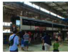
愛知高速交通株式会社 リニモ車両基地