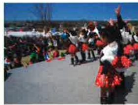
モリコロパーク春まつり