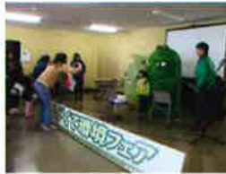
ながくて環境フェア (写真は昨年の様子)