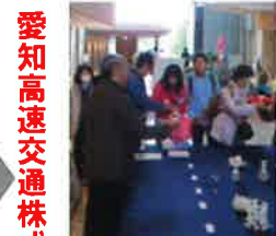
知の拠点あいちサイエンスフェスタ (写真は昨年の様子)